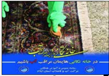
مدیرعامل شرکت آبفا ایلام: