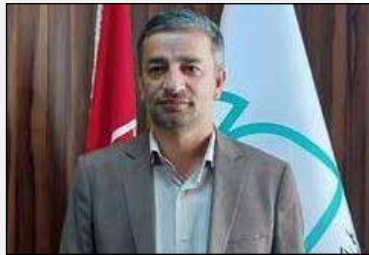
سرپرست استانداردا ایلام: