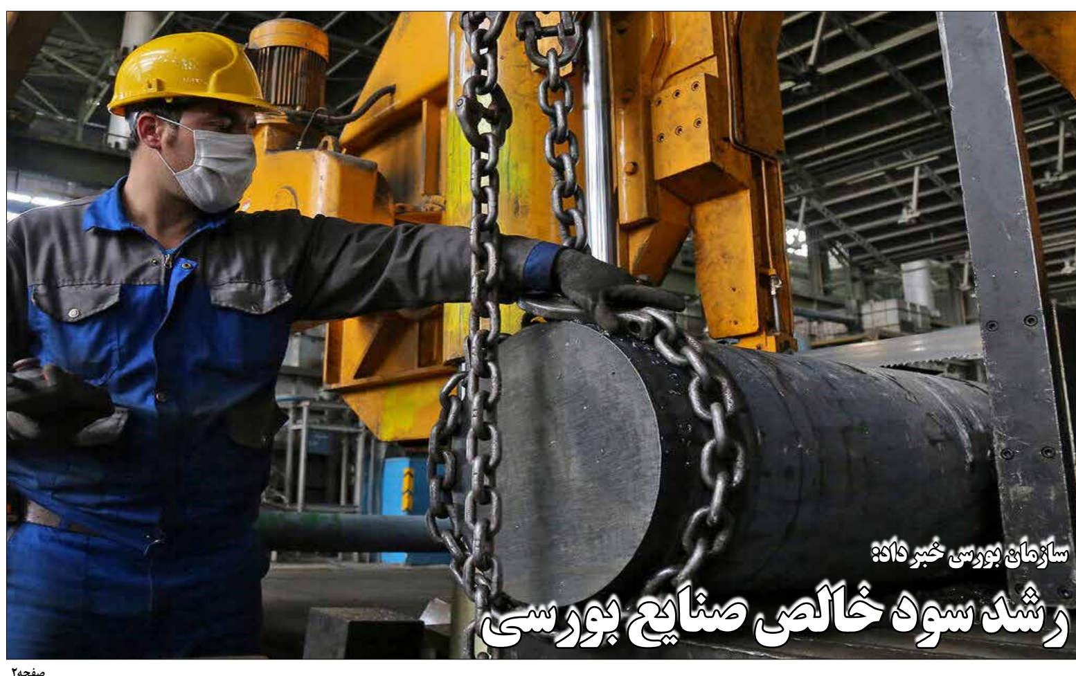
سازمان بورس و خبر داگه