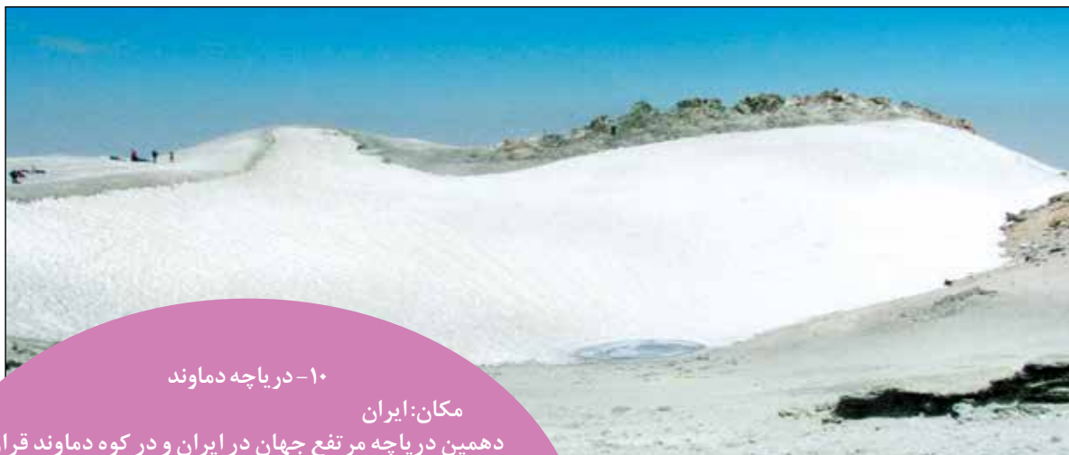
۱۰- دریاچه دماوند

پوکوانتیکادر کوه‌های آندس مرز بین شیلی و بولیوی و در ارتفاع ۵۷۵۰ متری از سطح دریا، در قله یک کوه آتش‌فشانی غیرفعال قرار دارد. زمین‌شناسان از این دریاچه به عنوان سرزمین عجایب یاد می‌کنند و آن را مکانی ایده‌آل برای بررسی اشکال مختلف زندگی در خارج از کره زمین و در مریخ می‌دانند. به اعتقاد آنها این دریاچه‌ها سهم بزرگی در زمینه‌های علمی خواهند داشت.