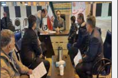
برپایی میز خدمت اداره کل بنیاد شهید و امور ایثارگران استان در محل مصلی شهر ایلام به مناسبت دهه فجر

میز خدمت اداره کل بنیاد شهید و امور ایثارگران استان در محل مصلی شهر ایلام برپا شد. ایلام - به گزارش روابط عمومی بنیاد شهید و امور ایثارگران استان ایلام، با حضور جمال اسدی مدیر کل بنیاد شهید و امور ایثارگران استان و مظفری رییس بنیاد شهید شهرستان ایلام به مناسبت دهه فجر و پنجمین سالگرد پیروزی انقلاب اسلامی و آغاز ایام الله دهه مبارک فجر، میز خدمت مردمی در محل مصلی شهر ایلام برپا شد. این میز خدمت در راستای تحقق تک‌ریسم ارباب رجوع، ارتباط مستقیم و دسترسی بی‌واسطه مردم به مسئولین و رسیدگی به مشکلات جامعه هدف برگزار شده است. در این میز خدمت تعدادی از جامعه هدف بنیاد شهید و امور ایثارگران استان به طور مستقیم و چهره‌به‌چهره با مدیر کل بنیاد شهید و امور ایثارگران استان ایلام مشکلات خود را مطرح کردند.