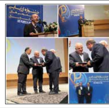
آیت الله آل هاشم:

بخشنده تاکید کرد: در شرکت لاکسون هیچ مرکزیتی در ایران ندارد و خارج از کشور است و از طریق یک صرافق این کار انجام می گیرد، ما می توانستیم روی سرشاخه ها کار کنیم که اقدام هم شد و اقدامات قضایی در این خصوص انجام می گیرد.