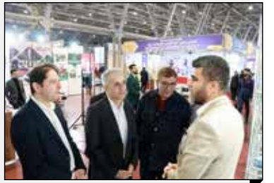
نایب رئیس اتاق بازرگانی اصفهان: