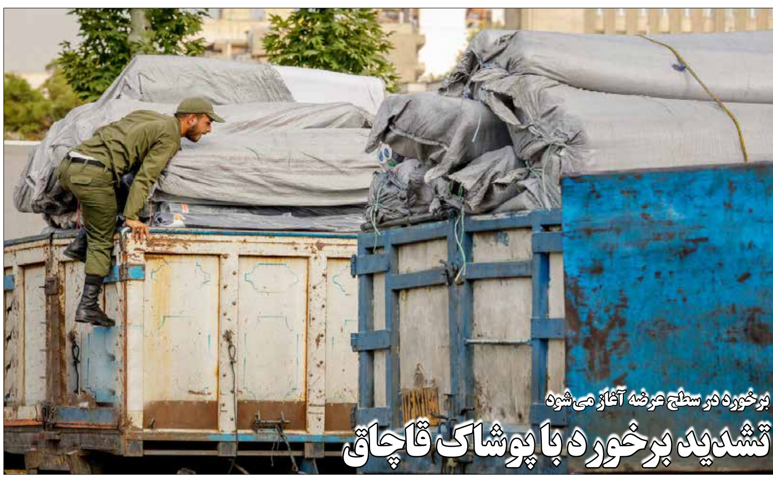
برخورده در سطح عرضه آغاز می شود