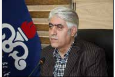
مدیر شرکت ملی پخش فرآورده‌های نفتی منطقه ایلام: