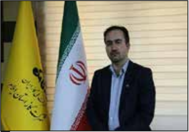
در ۹ ماهه نخست امسال؛

وی با بیان این موضوع که ملت شریف ایران با