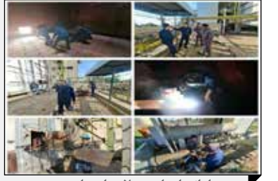
پس از انجام بازدید ۲ هزار ساعته؛