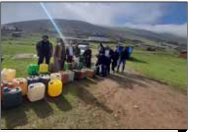
طی نه ماهه سال جاری؛