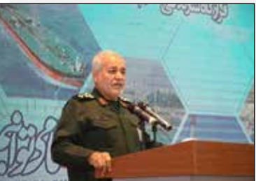
احداث پالایشگاه جدید برای تولید بنزین آغاز شد