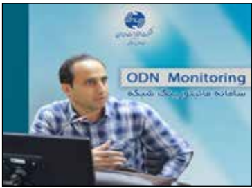
ارگان های ذیربط برگزار می‌گردد. تاریخ برگزاری نمایشگاه الی ۵ دیماه خواهد بود.

در این خصوص اقدام نموده است. اشرافیان پور در ادامه توضیحات خود افزود: بررسی وضعیت افت سیگنال در طول مسیر و شناخت محدوده قطع سیگنال با قابلیت یکپارچگی با سامانه های پشتیبان فنی و تجاری از مشخصات این سامانه می باشد. گفتنی است، نمایشگاه «ایران تلکام» که یکی از بزرگ ترین رویدادها و گر دهه‌مایی های مخابراتی کشور به شمار می رود، با همکاری شرکت سهامی نمایشگاه‌های بین المللی جمهوری اسلامی ایران، سازمان توسعه تجارت ایران و وزارتخانه‌ها و