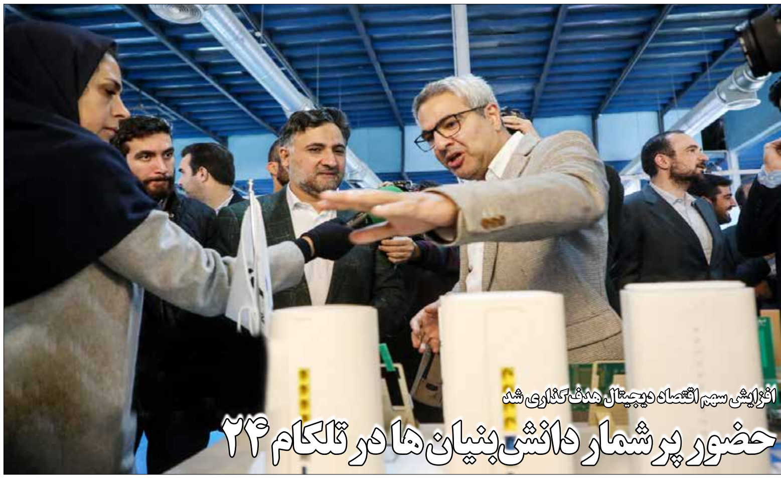
افزایش سهم اقتصاد دیجیتال هدف گذاری شد