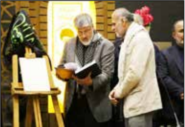
در یادواره شهدای ورزشکار بابل مطرح شد: