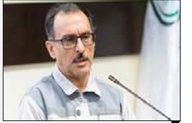
مدیرعامل شرکت پتروشیمی ایلام: