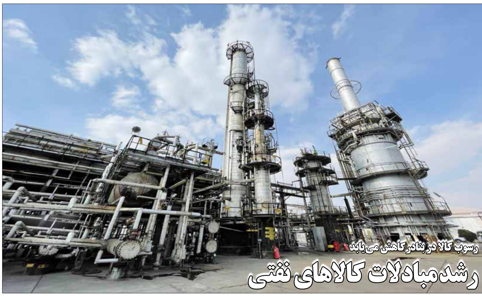
روسوب کالا در بنگاه کاشی می باید