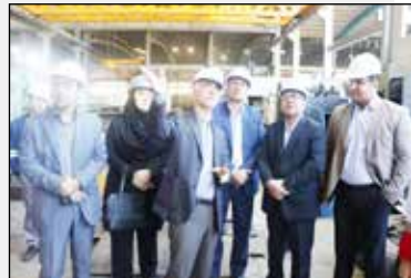
مدیر کل بازرسی کار و وزارت تعاون، کار و رفاه اجتماعی خبر داد: