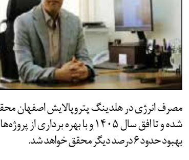
مدیرکل بازرسی کار و وزارت تعاون، کار و رفاه اجتماعی خبر داد:

پرند از کاهش ۱۴ درصدی حوادث ناشی از کار در کشور در سال گذشته نسبت به سال قبل آن خبر داد و گفت: خدمت‌کردن به حوزه صیانت از نیروی کار به عنوان یک اصل در اولویت قرار دارد.