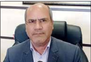
مدیرکل منابع طبیعی ایلام؛

به گزارش روابط عمومی و بین‌الملل هلدینگ پتروپالایش اصفهان، مدیریت انرژی هلدینگ پتروپالایش اصفهان برای نخستین بار در سومین ممیزی تخصصی فنی - سیستمی انرژی پالایش و پخش کشور شامل حوزه‌های واحدهای فرایندی،