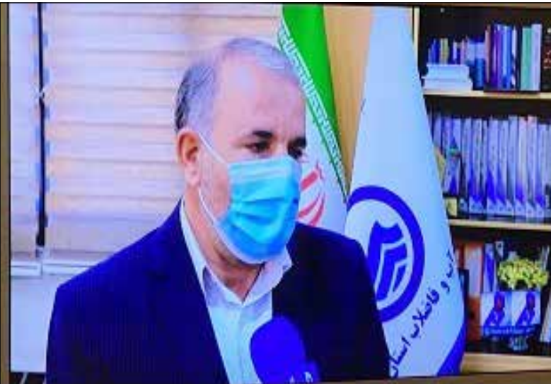
ار جاع داده شد. مدیرعامل شرکت آبفایلام یکی از اولویتهای مهم و جدی شرکت آبفای استان

و مقابله با استفاده کنندگان غیر مجاز گروه های نظارتی با هدف گشت زنی در محدوده های تعیین شده و شناسایی انشعاب های غیر مجاز تشکیل می شوند تا ضمن قطع این انشعاب ها و یا تبدیل آنها به انشعاب مجاز، امکان استفاده های غیر مجاز را کاهش دهند.