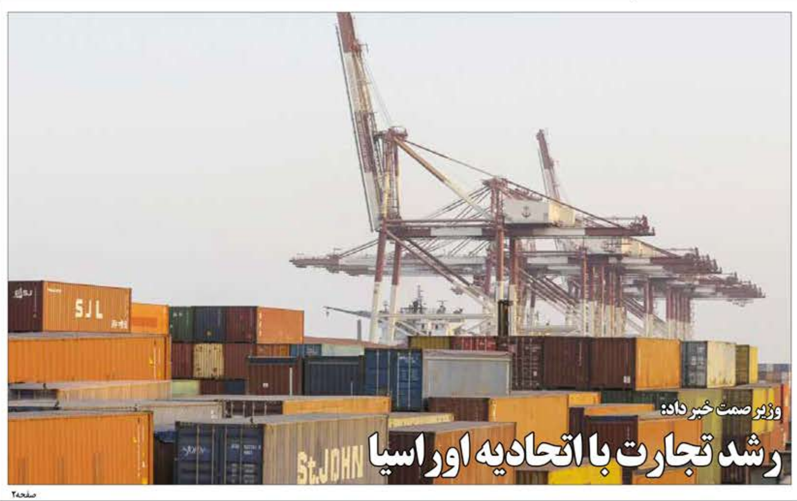
وزیر صمت خبر داد: