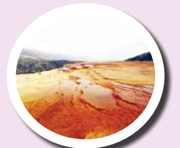
۲ باداب سورت

منطقه بیلاقی جواهردشت با موقعیت خاص در جوار قله سماموس، نزدیکی به کلاچای و همجواری به دریای خزر مناظر بسیار زیبایی از بازی کوه، ابر و جنگل را به نمایش می‌گذارد. هوای پاک، مناظر بکر و پیاده روی در کوهپایه‌های زیبای سماموس بسیار خاطر‌انگیز است.