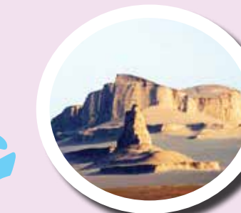
۶ کویر لوت و کلوت‌ها

اورامان نام ناحیه کوهستانی در مرز ایران و عراق در استان کردستان است. دره‌های زیبا با رودخانه‌های پر آب و مناظر بدیع به همراه معماری جالب طبقاتی روستاهای اورامان از دیدنی‌های جالب این منطقه است. زبان کهن اورامانی همان زبان اوستاست. نان محلی خاص این منطقه بسیار معروف و خوش خوراک است.