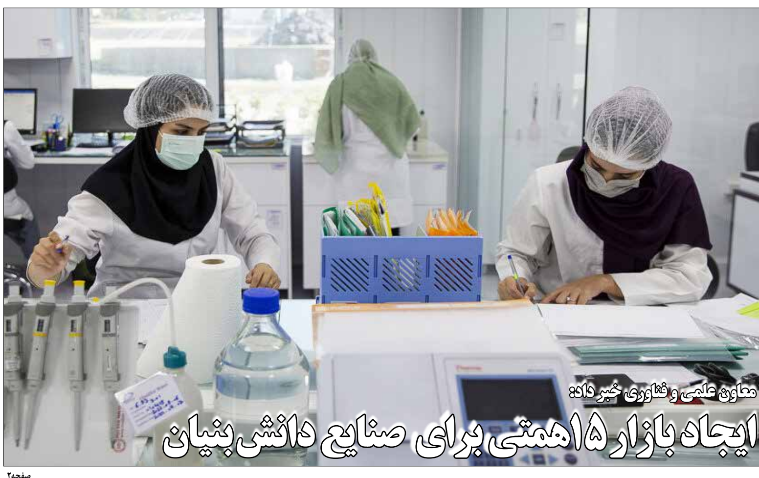
معاون علمی و فناوری خردخانه