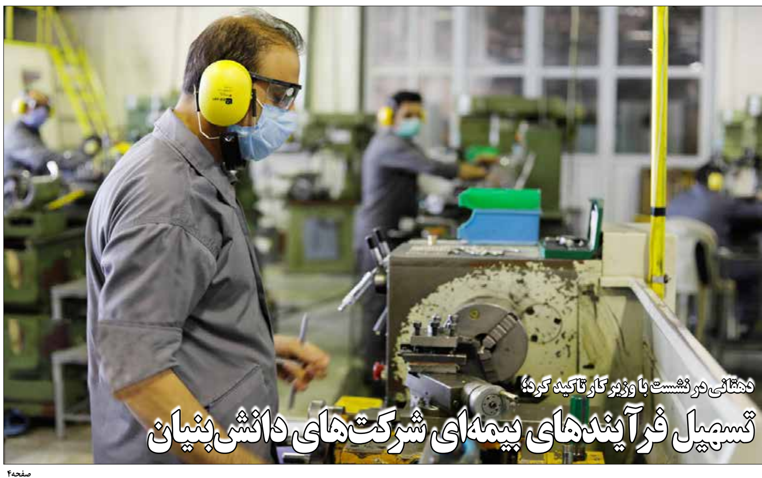
دهتائی در نشست با وزیر کار تاکید کرد: