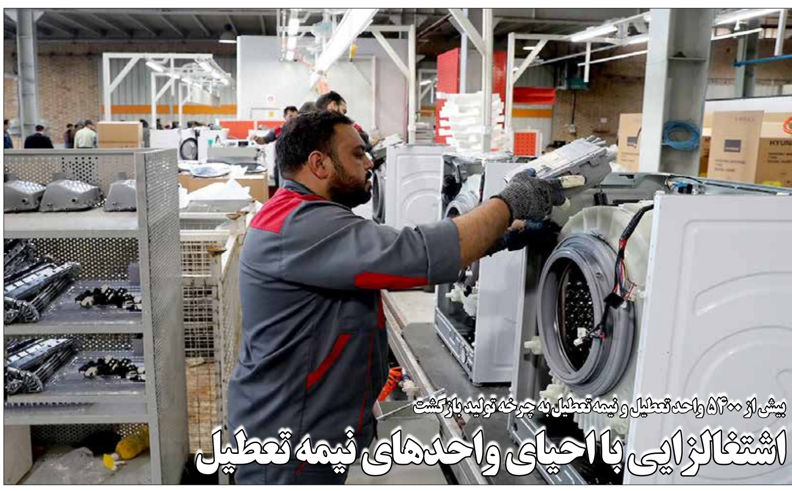
پیش از ۵۳۰۰ واحد تعطیل و نیمه تعطیل به چرخه تولید بازگشت