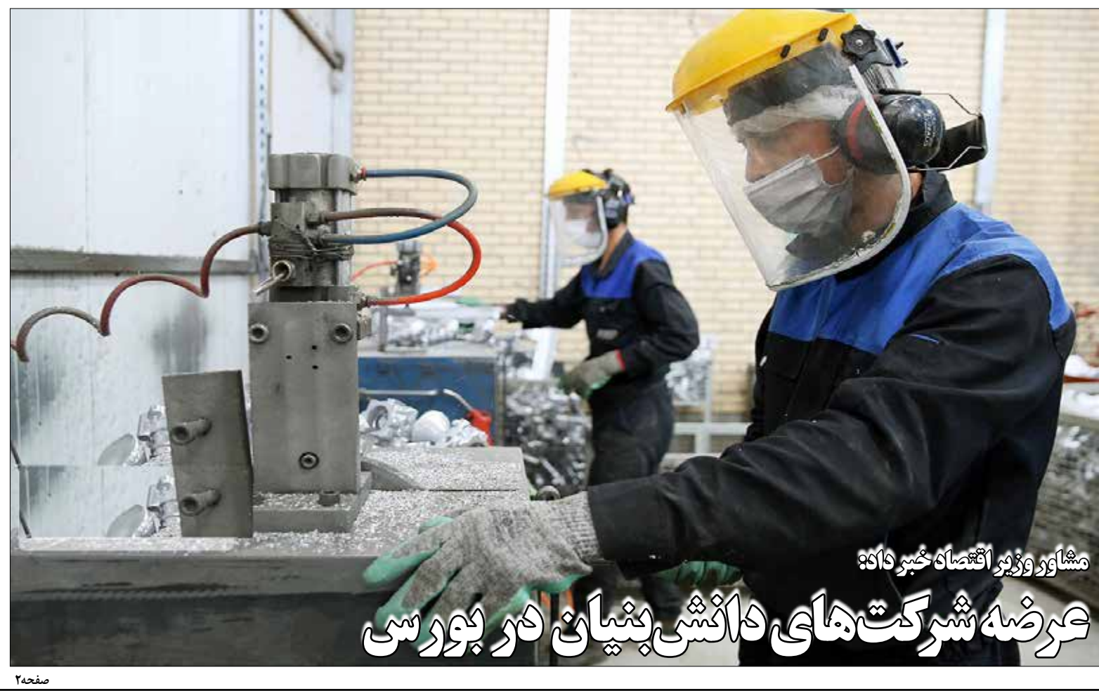
مشاور وزیر اقتصاد خبر داد: