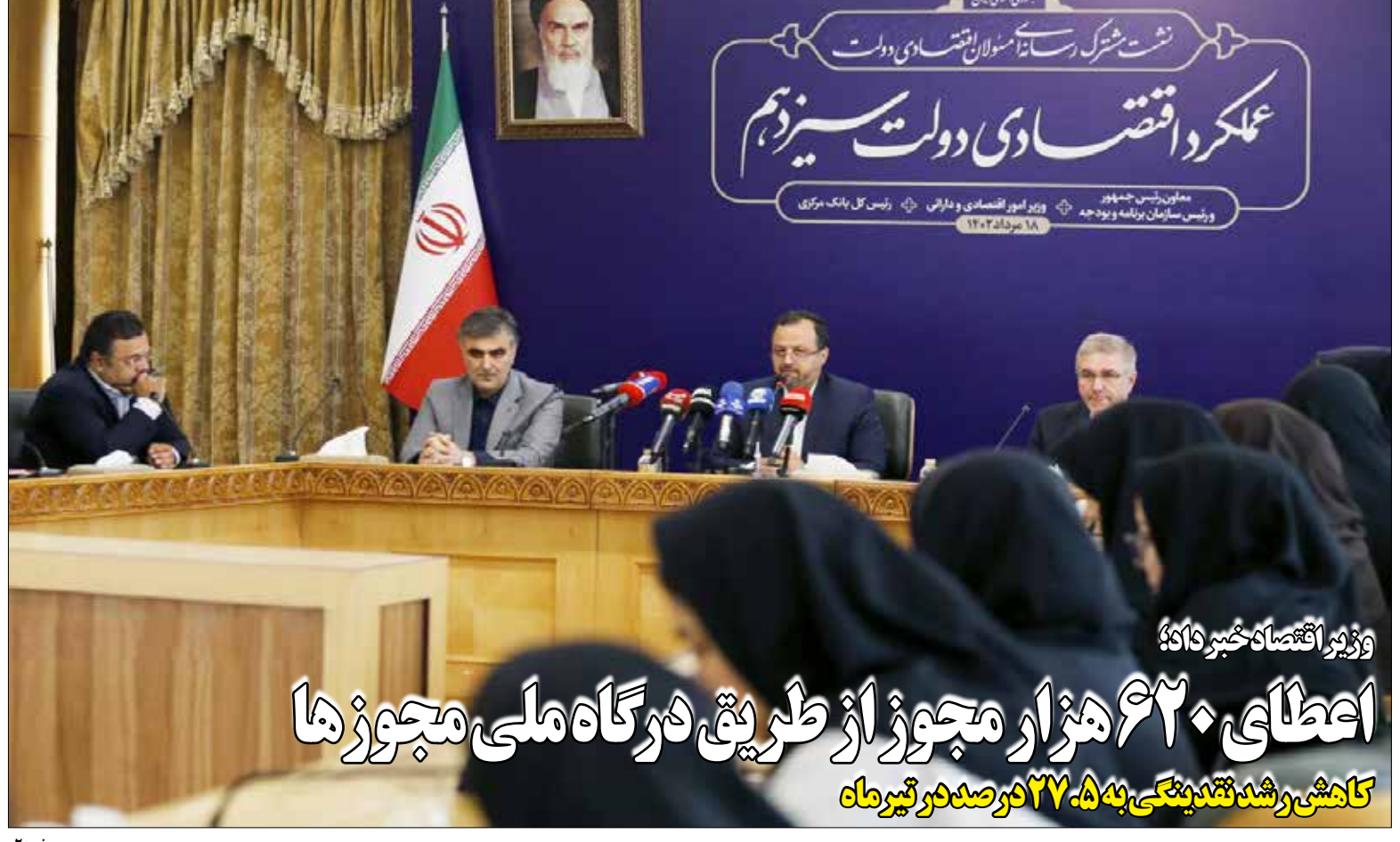
وزیر اقتصاد خبر داد

اعطای ۶۲۰ هزار مجوز از طریق درگاه ملی مجوزها کاهش رشد نقدینگی به ۲۷.۵ درصد تیرماه