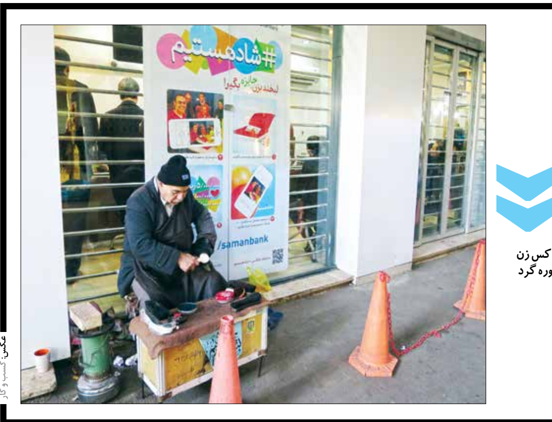
واکس زن دوره گرد

را تأمین می‌کند. یک فنجان ماست: هنگامی که سیستم گوارشی با مشکل روبه‌رو می‌شود، فرد احساس خستگی می‌کند. باکتری‌های مفید ماست کار تنظیم سیستم گوارشی را به عهده دارد. مصرف روزی ۲۲۴ گرم ماست، خستگی مفرط را در عرض یک هفته از بین می‌برد. اگر خستگی مفرط همراه با علائم دیگر مانند کاهش تمرکز و قدرت حافظه، گلودرد، سردرد و درد عضلانی تا ۶ ماه ادامه پیدا کند، مراجعه به پزشک ضروری است. متخصصان می‌گویند مصرف غذای مناسب برای مقابله با خستگی مفرط اهمیت ویژه‌ای دارد.