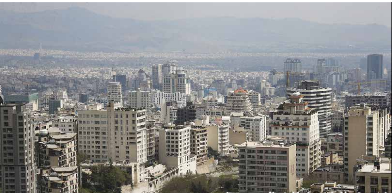
نرخ سوه تسهیلات نهضت ملی کاهش یافت