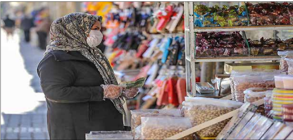
یک زن در حال خرید در بازار تهران.

داوود منظور افزود: مهم‌ترین نکته در تدوین بر نامه ما این بود که اولاً تلاش کنیم مسئله‌های اصلی کشور را حل کنیم و از نظر ما مهم‌ترین مسئله‌های کشور همانی است که در سیاست‌های ابلاغی قید شده به عنوان مثال یکی از مشکلات ما به ویژه در یک دهه اخیر مسئله کم رشدی است یعنی در ده سال گذشته متوسط رشد اقتصادی ما از یک درصد کمتر است و برخی برآوردها می‌گوید هفت دهم درصد؛ این مسئله را به‌عنوان یکی از چالش‌های اصلی باید به آن بپردازیم این مسئله را