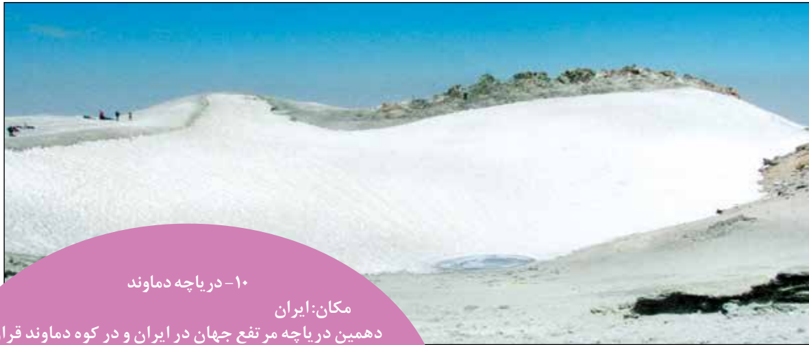
۱۰- دریاچه دماوند

پوکوانتیکادر کوه‌های آندس مرز بین شیلی و بولیوی و در ارتفاع ۵۷۵۰ متری از سطح دریا، در قله یک کوه آتش فشانیه غیر فعال قرار دارد. زمین‌شناسان از این دریاچه به عنوان سرزمین عجایب یاد می‌کنند و آن را مکانی ایده‌آل برای بررسی اشکال مختلف زندگی در خارج از کره زمین و در مریخ می‌دانند. به اعتقاد آنها این دریاچه‌ها سهم بزرگی در زمینه‌های علمی خواهند داشت.