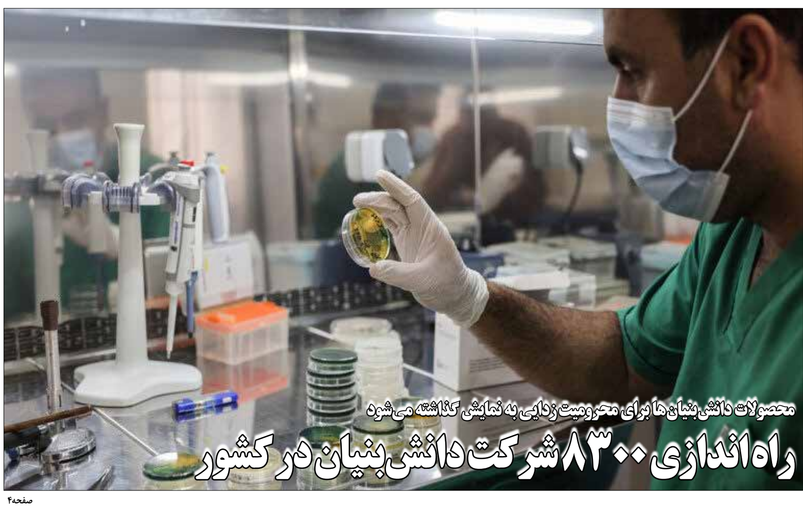
محصولات دانش بنیانها برای محرومیت زدایی به نمایش گذاشته می شود