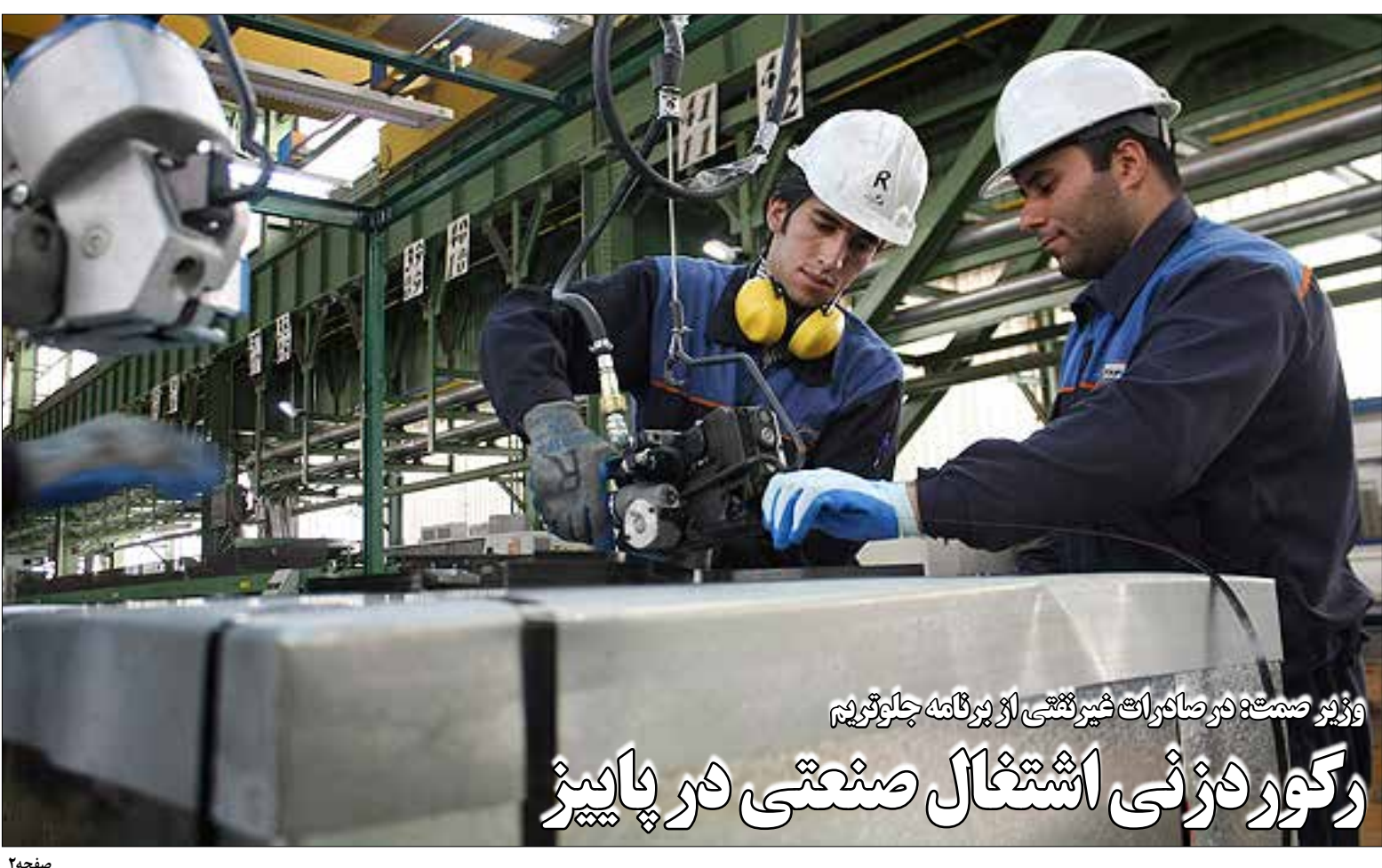
وزیر صنعت در صافرات شیرکتی از پرولانه چلوتیریم