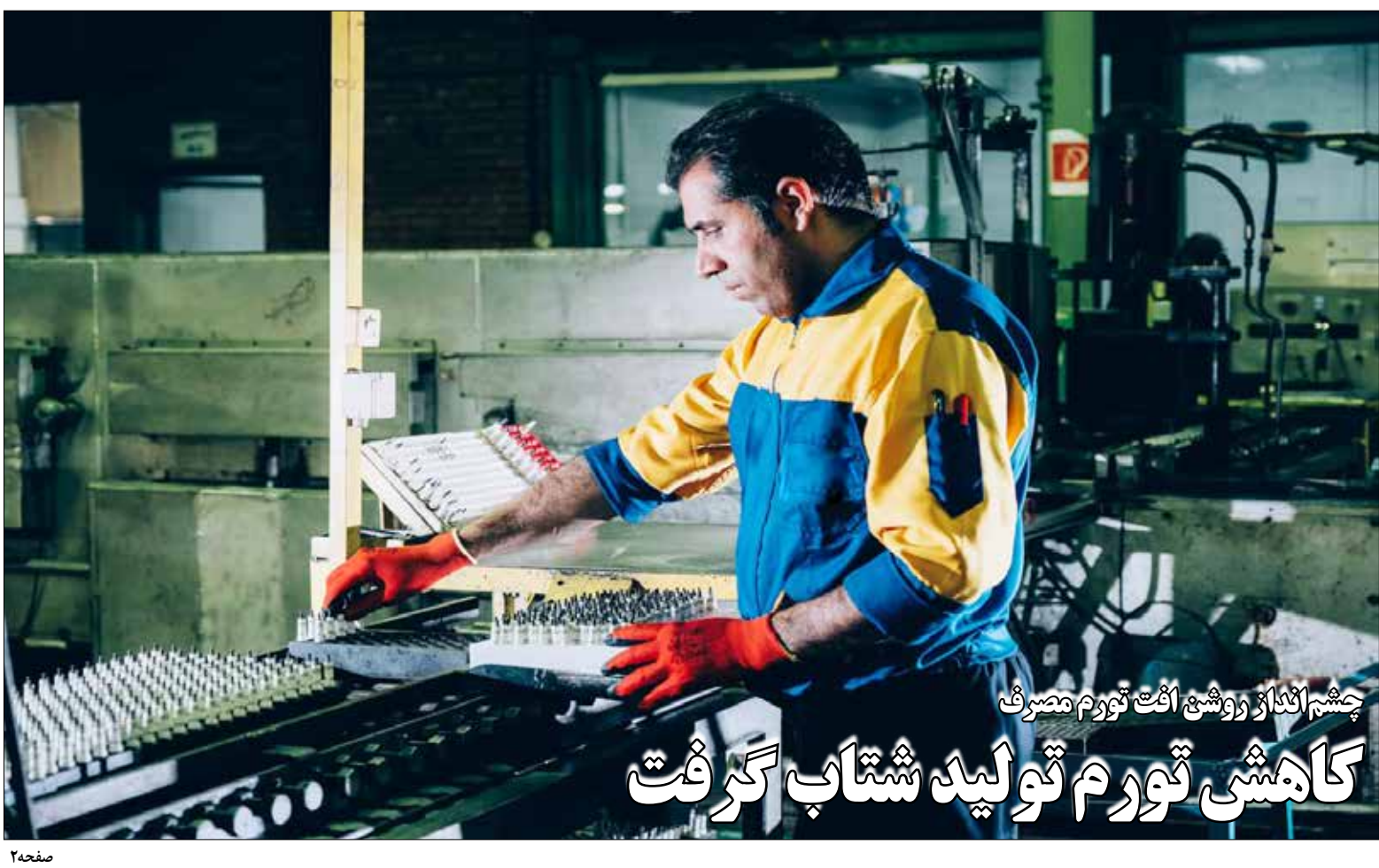
چشم انداز روشن افق تورم مصرف