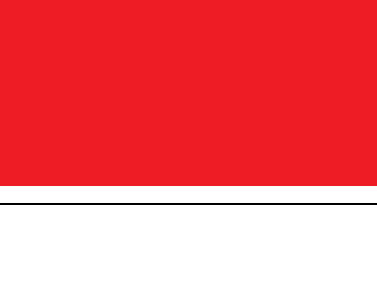
امیر هیبت مدیره اتحادیه مرغداران میهن

رئیس اتحادیه فروشنندگان لوازم خانگی تهران با اشاره به لزوم تمرکز بر شرکت های دانش بنیان و موفقیت های چشمگیر ناشی از آن بیان داشت: در حوزه دانش بنیان ها می توان از اصناف از طریق فروش در فضای مجازی کمک گرفت. هر چند متأسفانه در سه سال شیوع ویروس کرونا بدقولی هایی از دولت سابق در حمایت از مشکلات مالیاتی اصناف صورت گرفت، اما خوشبختانه برخی از اتحادیه ها مانند لوازم خانگی علی رغم بنیه ضعیف شروع به کار و تولید کردند و توانستند به صنف خود کمک کنند.