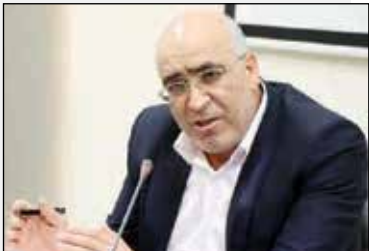
یازسا ابلاغ کرد