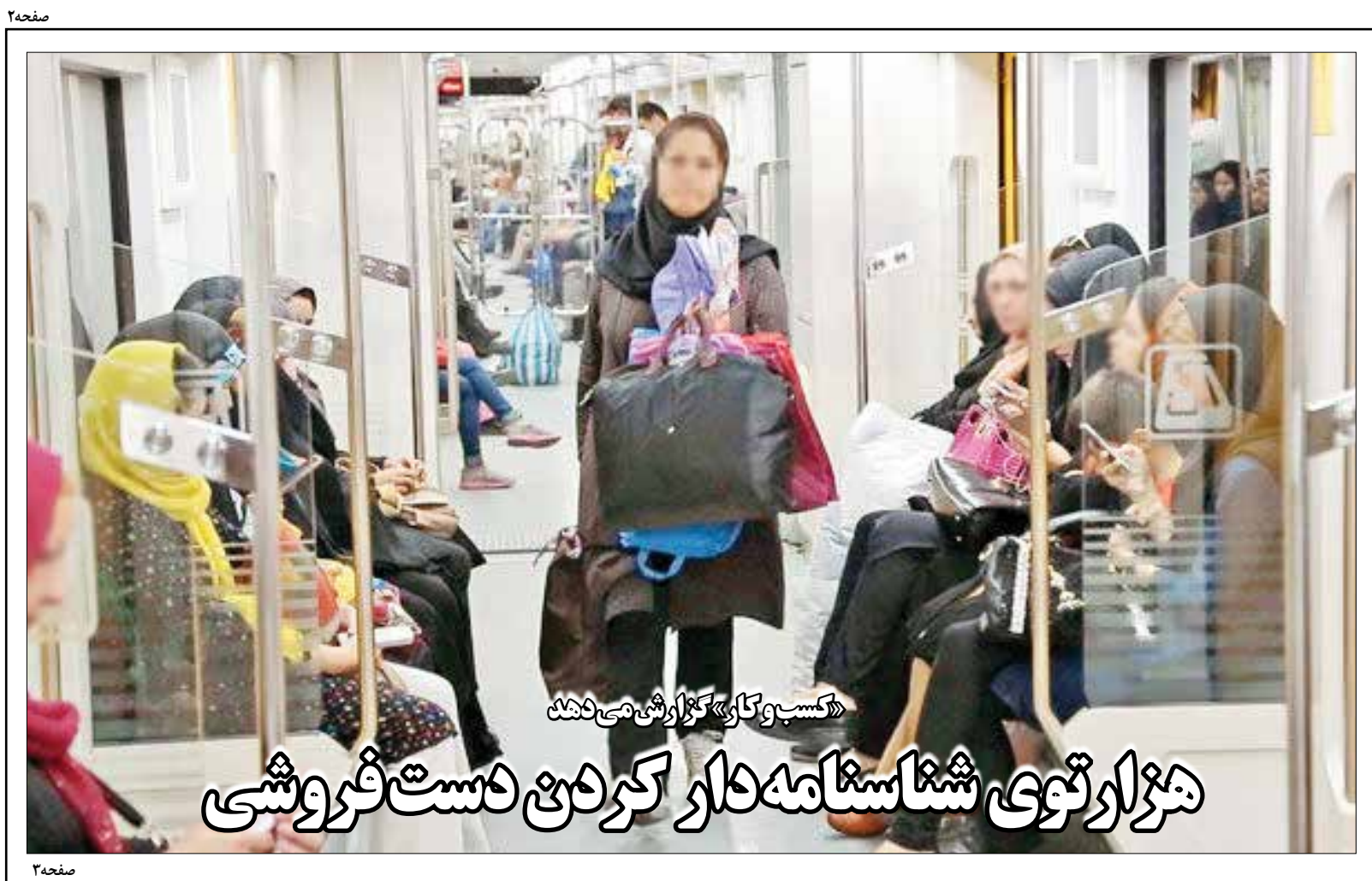
شماره ۲ | هزارتوی شناسنامه دار کردن دستفروشی