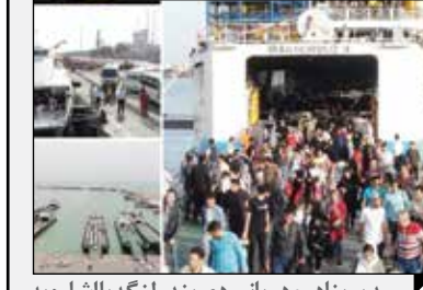
مدیر بنادر و دریانوردی بندر لنگه با اشاره به کارنامه سال ۹۷ اعلام کرد