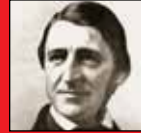
رالف والدن امرسون

تمرکز، راز قدرت در سیاست، جنگ، تجارت و به طور خلاصه راز قدرت در تمامی امور انسانی است.