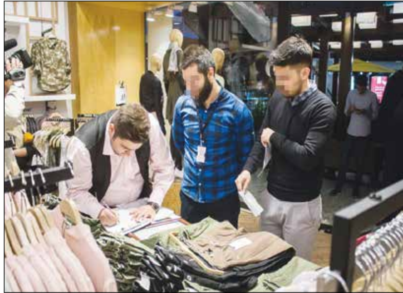
شده است. این تعداد صدر صد شناسه کالا ندارد و از فرصت داده شده استفاده نکرده اند. سخنگوی ستاد مبارزه با قاچاق کالا و ارز با اشاره به اینکه مدیران ۴۰